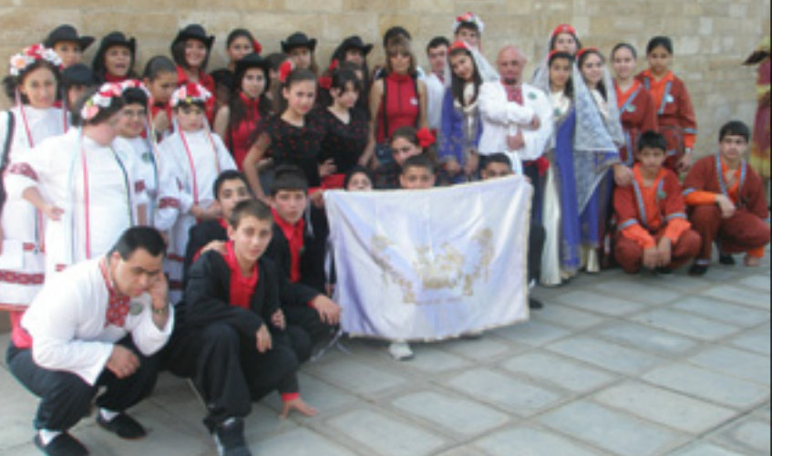
AUB-ի կազմակերպած ժողովրդային պարերու 35-րդ փառատօնը տեղի ունեցաւ Կիրակի, 10 Մայիսի երեկոյան ժամը 6:00-ին "Green Field" մարզադաշտին վրայ:

Այս փառատօնին իրենց մասնակցութիւնը բերին 17 տարբեր վարժարաններու պարախումբեր, որոնք ներկայացուցին 10 երկիրներու պարեր: