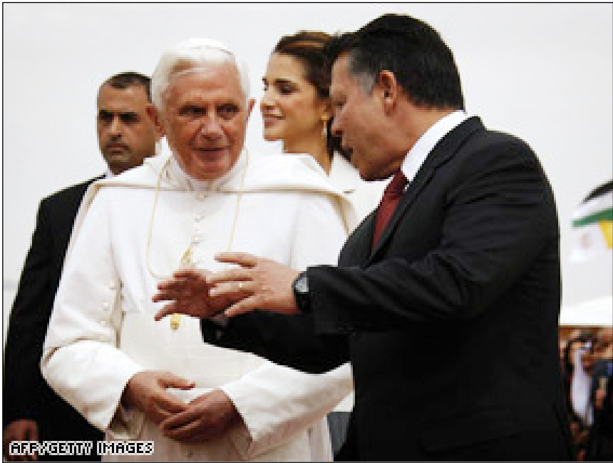
Հռոմի Պենտիքթոս 16-րդ Պապը երկն սկսաւ դէպի Սուրբ Հոլեր իր հավուպետական այցելութեան:

Պենտիքթոս Պապը իր ուղեւորութիւնը սկսաւ Յորդանան այցելութեամբ, ուր Ապտալլա երկրորդ վեհապետը անձամբ ընդունեց Հռոմի քահանայապետը: Այս առիթով արտասանած իր խօսքին մէջ, Պապը երկխօսութեան նոր էջ մը բանալու կոչ ուղղեց