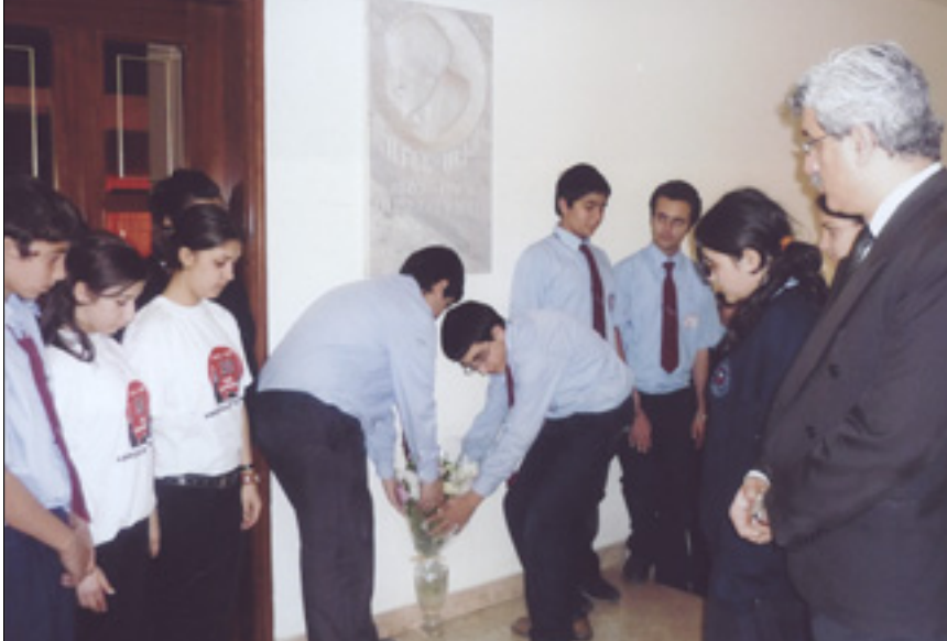
Սահակեան-Լ. Սկրտիչեան Գոլէճի աշակերտներ ծաղիկներ կը տեղադրեն Նահատակ հայ մտաւորական, ցեղասպանութեան զոհ դարձած Ռուբէն Սեւակի արձանին առաջ:

Չառկուան երկար արձակուրդէն դպրոց վերադարձին, այլ խօսքով, Երեքշաբթի, 21 Ապրիլի առաւօտեան ժամերէն սկսեալ սովորական կեանքը փոփոխութիւն կրած էր Հ. Կ. Բ. Մ.-ի Սահակեան-Լ. Սկրտիչեան Գոլէճի ամօրեայէն ներս: Աշակերտները լծուած էին մեղուաչան աշխատանքի, լաւապէս ներկայացնե-